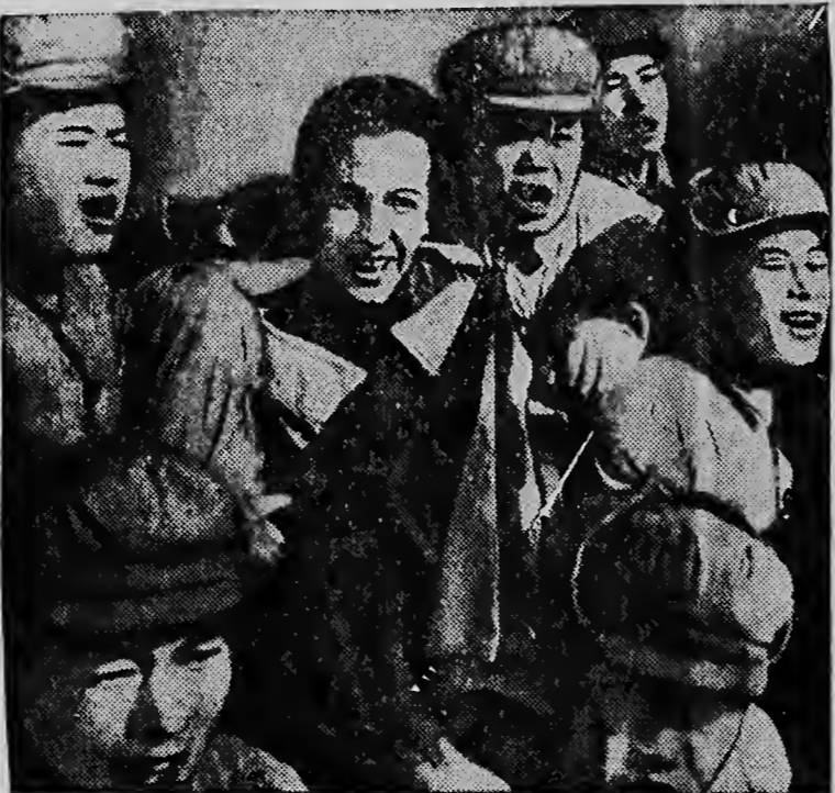
VIER van de 21 Amerikanen, die er de voorkeur aan gaven in Russische handen te blijven, inplaats van naar eigen land terug te keren, wuiven op bovenstaande foto's (voor het laatst?) naar de Amerikaanse zone, voor zij naar het Noorden vertrekken...